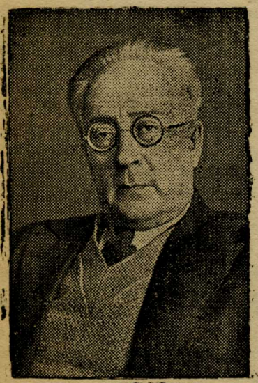
Виде-президент Академии наук Союза СССР академик В. П. Волгин.

секретарь РК ВЛКСМ по агитации и пропаганде.