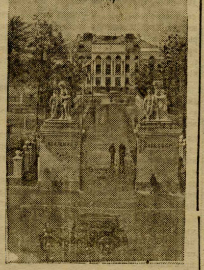
Здание Президиума Академии наук СССР (Москва.)

После доклада — художественная самодеятельность и кино картина. Начало в 8 час. вечера.