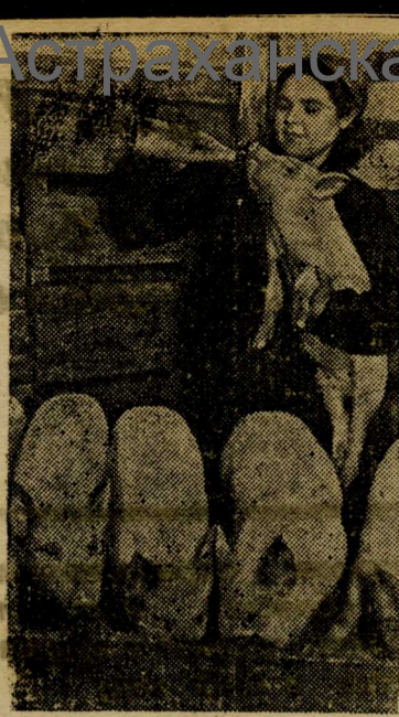
В колхозе имени Володарского, Ново-Александровского района, Ставропольского края, полностью восстановлены все животноводческие фермы, разоренные немцами.