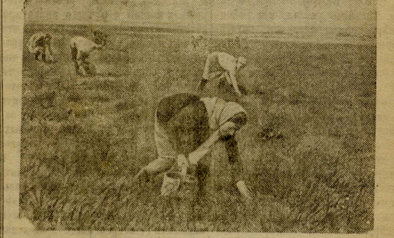
Сорную траву — из поля вон!

Уход за посевами — очень важный этап борьбы за урожай. Непрополотые посевы недодают, примерно, третью часть урожая.